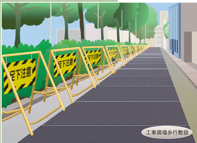
工事現場歩行敷設