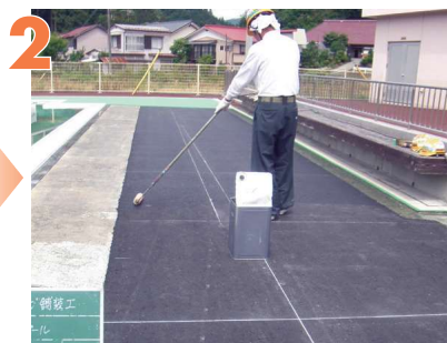
2 プライマーの塗布