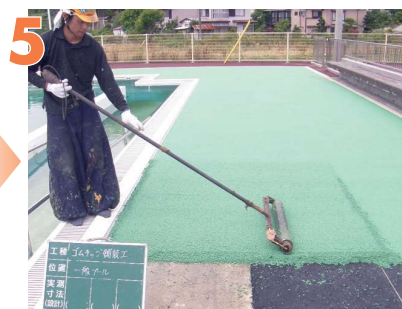
5 電熱ローラーで転圧