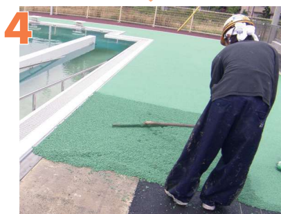
4 材料を均一にならす